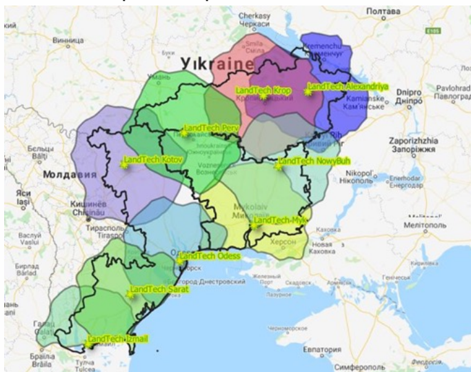
Зображення 1. Мапа покриття території України

В 2024 році дилерська мережа Ландтех складалась з 9-ти дилерських центрів (м.Кропивницький, м.Миколаїв, м. Первомайск, м.Одеса, м.Сарата, м.Подільськ, м.Ізмаїл, м. Олександрія, м. Новий Буг), в яких кожен клієнт може отримати консультації спеціалістів, якісний сервісний ремонт та запчастини для їхньої техніки.